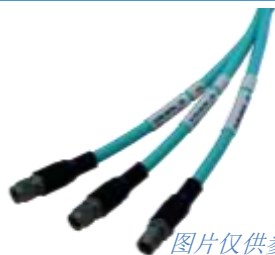
图片仅供参考，以实物为准

TC40 系列微波测试电缆组件有三种可选型号, 分别为 TC40-C 型 (无护套)、TC40-W 型 (编织护套)、TC40-S 型 (橡胶护套)。TC40 系列电缆组件十分柔软, 适合实验室应用。